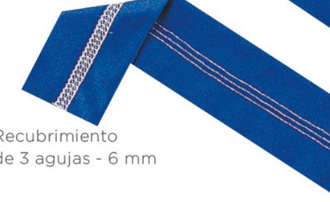
Recubrimiento de 3 agujas - 6 mm