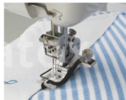
Prensatelas guía de centro