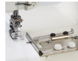
Guía de dobladillo

Distribuidor en España Recambios y Maquinaria Textil S.A. Llull, 125 · 08005 Barcelona Tel +34 93 486 45 00