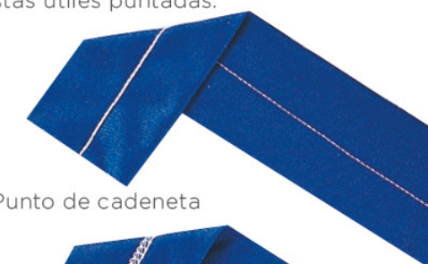
Punto de cadeneta

La 2000CPX es una máquina de 3 agujas - 4 hilos. Disfruta de estas útiles puntadas: