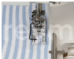
Prensatelas de recubrimiento transparente