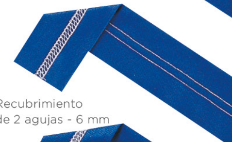
Recubrimiento de 2 agujas - 6 mm