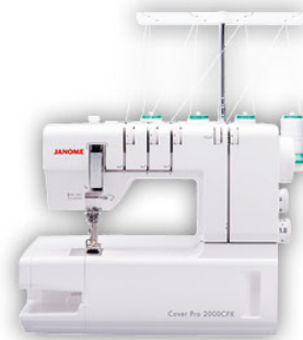
CoverPro 2000 CPX