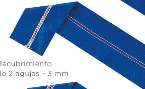
Recubrimiento de 2 agujas - 3 mm